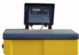
Op de pomp | Sur la pompe