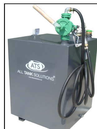
Verdeelinstallatie met handpomp type K2 en tankset 3C